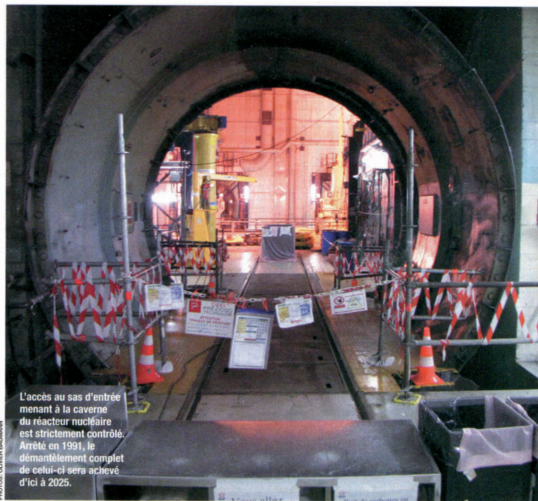
L'accès au sas d'entrée menant à la caverne du réacteur nucléaire est strictement contrôlé. Arrêté en 1991, le démantèlement complet de celui-ci sera achevé d'ici à 2025.