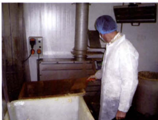
Les capteurs Delta Neu fixes et à bras télescopiques et articulés aspirent les poussières alimentaires autour du poste de pesée.