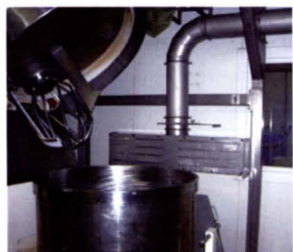
Un capteur Delta Neu aspire les poussières au niveau du malaxeur.