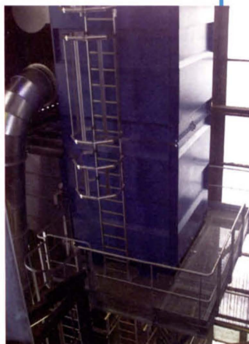
Le dépoussiéreur Jetline V2 Atox de Delta Neu chez Saipol.

à décolmatage automatique pneumatique type Jetline V2 (surface filtrante 180 m 2 ), et d'un ventilateur centrifuge en inox à haut rendement (45 kW) à transmission. L'installation Delta Neu chez Saipol a permis ainsi d'obtenir un taux de poussières dans l'air inférieur à 5 mg par m 3 d'air traité. ●